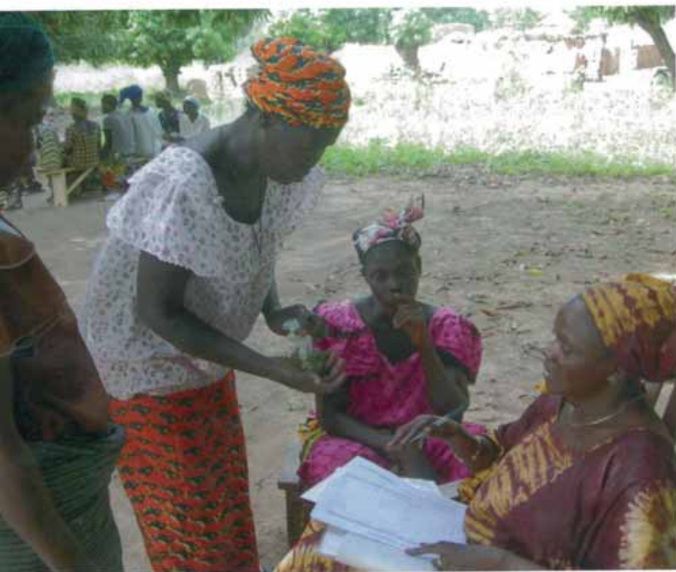
Femme d'une mutuelle de solidarité de l'association burkinabé Asiena achetant de la spiruline à moitié prix lors d'une vente sociale.

structure porteuse sans générer de profit puisque la totalité des bénéfices de vente sont laissés au vendeur. Il faudrait en plus, pouvoir proposer la spiruline au prix social soit 0,10 euro par dose quotidienne pour que l'offre soit solvable.